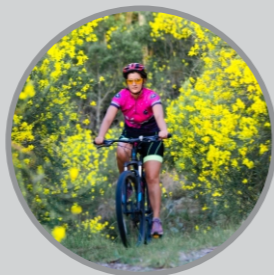
Reserva Natural Fundación Fangio