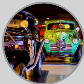
Museo Juan Manuel Fangio