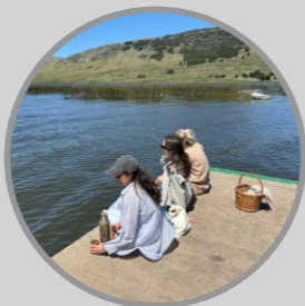
Laguna La Brava