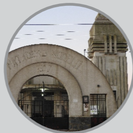
Obras de Arq. F. Salamone