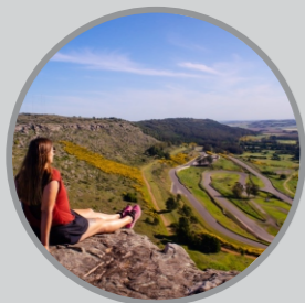
Autódromo J. M. Fangio